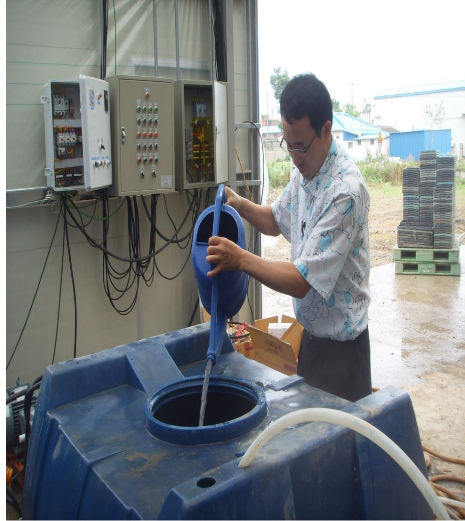
물 3L에 희석한 엑스칼리버-골드를 물 300L에 혼용