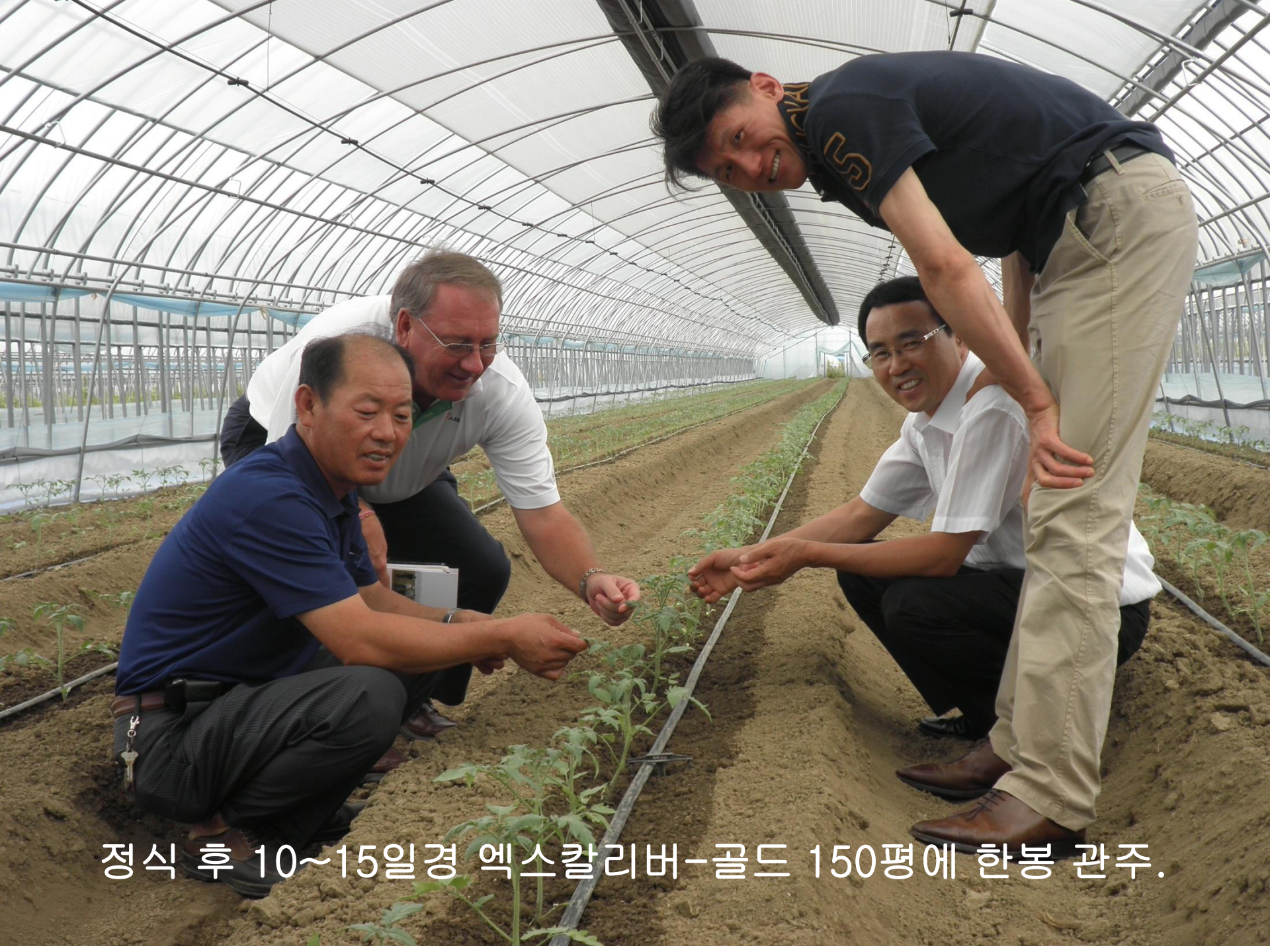
정식 후 10~15일경 엑스칼리버-골드 150평에 한봉 관주.