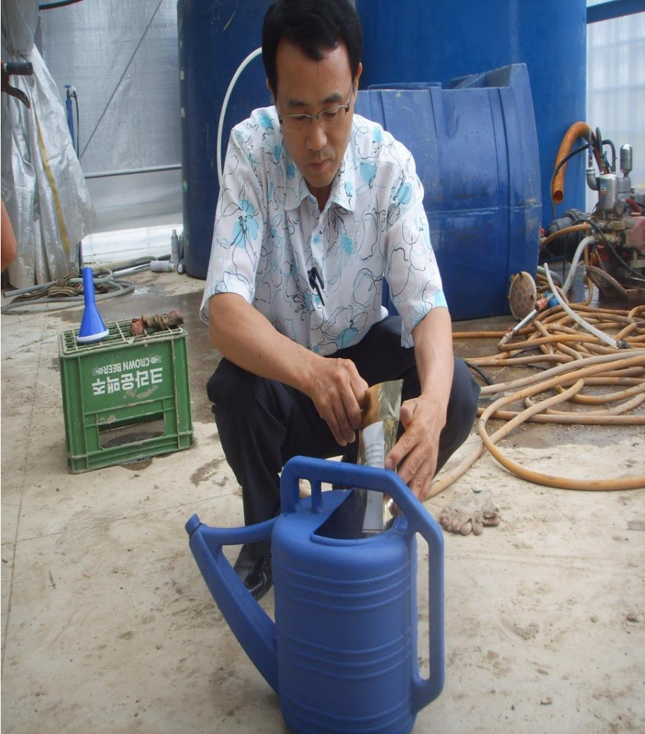
엑스칼리버-골드 : 1봉을 물 3L에 희석